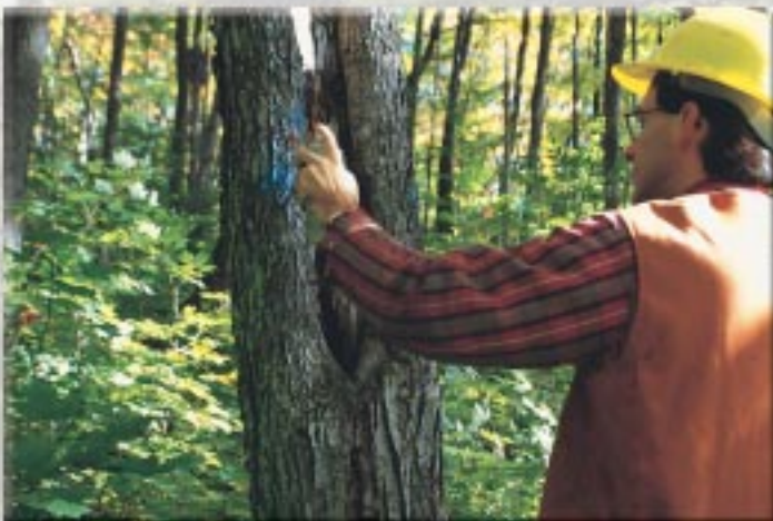
Dans une coupe de jardinage, on récolte tout au plus un arbre sur trois. On laisse sur place les arbres les plus sains et de tous les âges

Dans un premier temps, on doit marquer individuellement les arbres à couper afin de dégager les sujets les plus prometteurs ou plus petits. C'est l'étape qu'on appelle « marquage » ou, plus communément, « martelage ». On choisit de couper d'abord les arbres qui sont malades ou difformes et dont les parties saines peuvent être utilisées par les usines. Ensuite, on récolte les arbres qui nuisent aux jeunes tiges d'avenir et, finalement, les vieux arbres sains qui ne grandissent plus. Cette coupe comprend, tout au plus, le tiers des arbres d'un secteur donné.