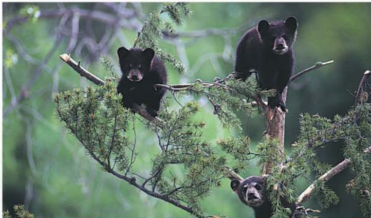
Pierre Bernier, MRNFP

Environ 90 % des forêts québécoises sont publiques, c'est-à-dire qu'elles appartiennent à tous les Québécois et qu'elles sont gérées, en leurs noms, par le gouvernement du Québec. Pour assumer cette responsabilité, celui-ci s'est doté d'un régime forestier. Le régime forestier est constitué d'un ensemble de lois et de règlements qui assure la protection et le renouvellement des forêts tout en permettant le développement économique du Québec.