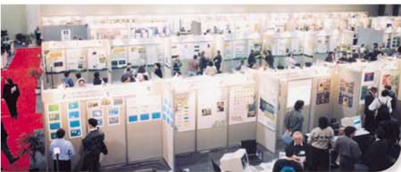
Exposants, conférenciers ou visiteurs, plus de 1500 personnes sont attendues à cet événement qui voit sa clientèle s'accroître régulièrement; la photo nous montre une partie de l'exposition du dernier carrefour, en 1997

Cette activité de transfert de technologie ayant démontré son importance et son efficacité dans le passé, l'ensemble des intervenants forestiers du Québec ont formulé le désir de renouveler la tenue d'un tel événement. En 2003, c'est la Direction de la recherche forestière (DRF) du ministère des Ressources naturelles qui sera le maître d'œuvre de cet événement.